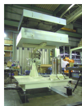
スプレー式塗油装置 Oiler (Spray type)