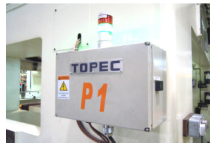
成形機信号中継盤 Signal relay box