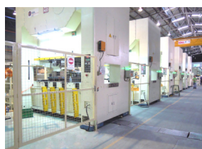
門型リンクモーションプレス Link motion press 300t on X 6uni

Press, Material supply, Oiling, Cleaning, Auto robot tool changer, Scrap conveyor, Palletizing, Various special machine